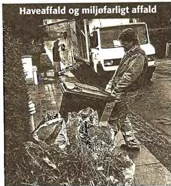
Haveaffald og miljøfarligt affald

Nyhed Som noget nyt indsamler R98 nu elektrisk og elektronisk affald separat. Elektronikskrot afhentes sammen med det almindelige storskrald, men skal placeres ved siden af, så det kan indsamles særskilt.