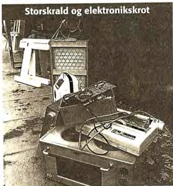
Storskrald og elektronikskrot

Nyhed Som noget nyt indsamler R98 nu elektrisk og elektronisk affald separat. Elektronikskrot afhentes sammen med det almindelige storskrald, men skal placeres ved siden af, så det kan indsamles særskilt.